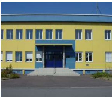
27 e Groupe vétérinaire

Des chefs des groupes vétérinaires des armées relevant de la direction de la médecine des forces (DMF) assurent l'encadrement et le pilotage des activités vétérinaires des groupes vétérinaires relevant de leur autorité fonctionnelle.