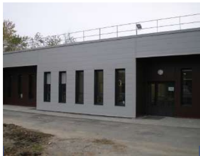
32 e Groupe vétérinaire