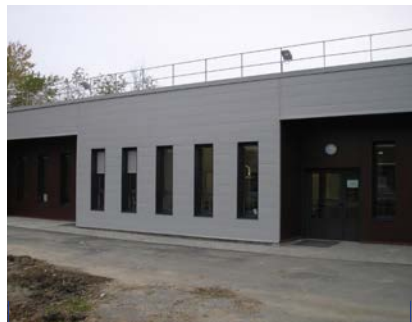
32 e Groupe vétérinaire